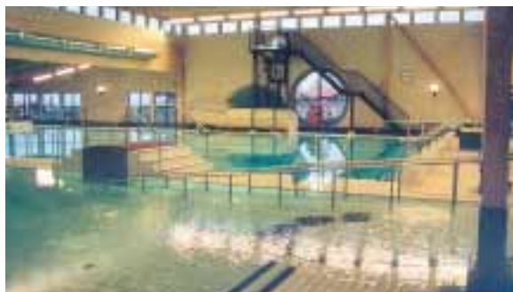
Det mesta av inredning och utrustning har levererats av Malmsten AB i Åhus, marknadsledande i landet när det gäller simhallsutrustning.

Den stora vattenrutschbanan, som delvis ligger utvändigt av själva badhusbyggnaden, har också levererats av Malmsten. En bana, av märket KANAB, som tillverkas av egna företaget Hydrosport i Gävle. Vattenrutschbanor från Hydrosport finns på badanläggningar i mer än 25 länder runt om hela världen.