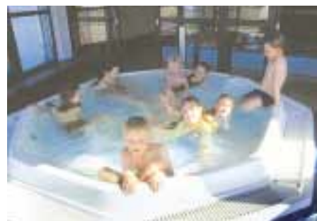
Borgholms badhus har blivit en populär mötesplats och inneburit ett lyft för hela kommunen.

Drygt 20 miljoner kronor beräknades bygget av badhuset kosta och Kapelludden AB vågade inte satsa så mycket pengar utan vissa garantier. Därför skrev man kontrakt med Borgholms kommun om att de skulle hyra in sig i badet för skolornas simundervisning. Ett