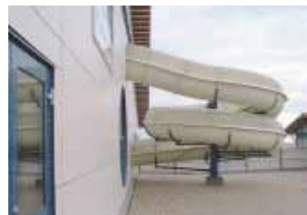
Vattenrutschbanan av märket KANAB har levererats av Malmsten AB i Åhus och tillverkats av dotterföretaget Hydrosport i Gävle.

– Vi var rädda för att få höga driftskostnader så vi satte ett tak som entreprenören