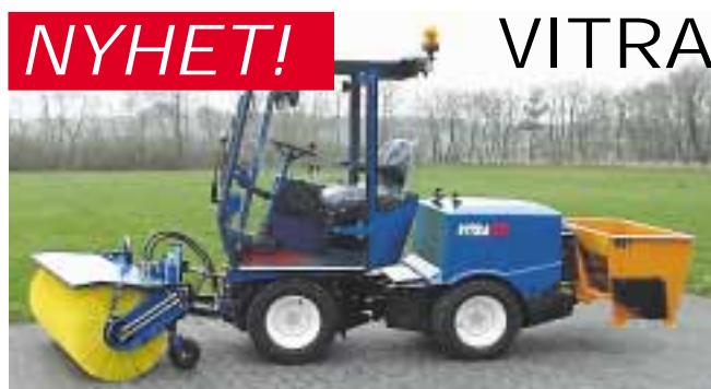
NYHET! VITRA Redskapsbärare 37 hk. 4 WD, 30 km/h Bredd 104 cm, ljudnivå endast 74 db, Kraftig hydraulik och stort redskapsprogram.