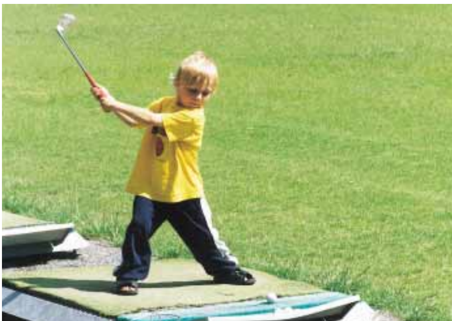
Golfintresset i Sverige blir allt större och kryper även ner i åldrarna.

produkter för gräskötsel på golfbanor och andra sportarenor samt i parker.