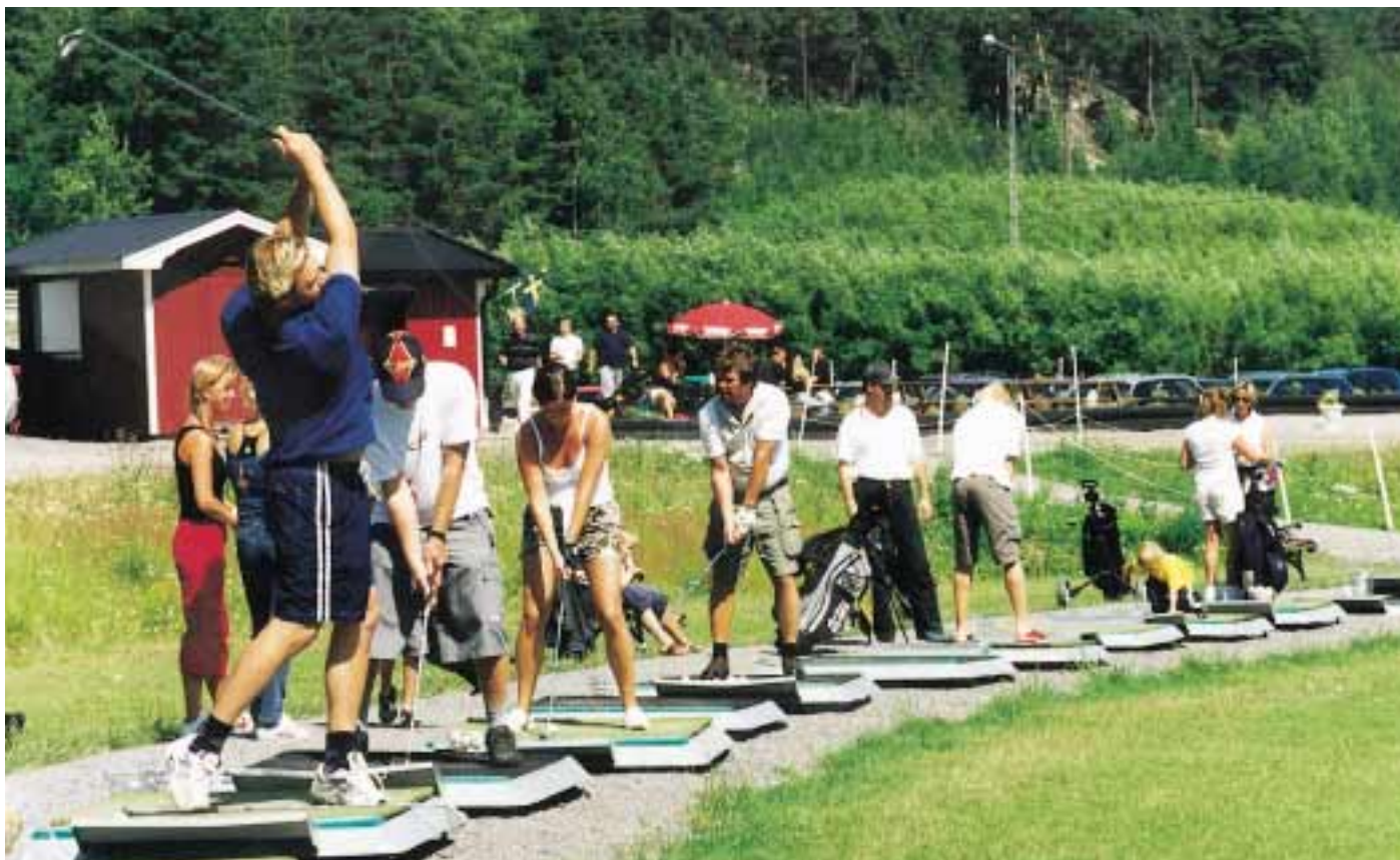
En ny golfbana fylls snabbt av spelsugna. Trycket på banorna är högt och enbart i Storstockholm köar omkring 50 000 personer.

Fors Golf ligger utmed väg 73 (Nynäshamnsvägen) i Västerhaninge, bara 20 minuter från Globen. En nyanlagd 9-håls parkbana med range, som under året kommer att kompletteras med ett