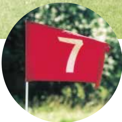
På Fors Golf använder man sig av Toro maskiner från Hako Ground & Garden i Järfälla. Alla typer av aluminiumskyltar har tillverkats av Alucon i Skogås.