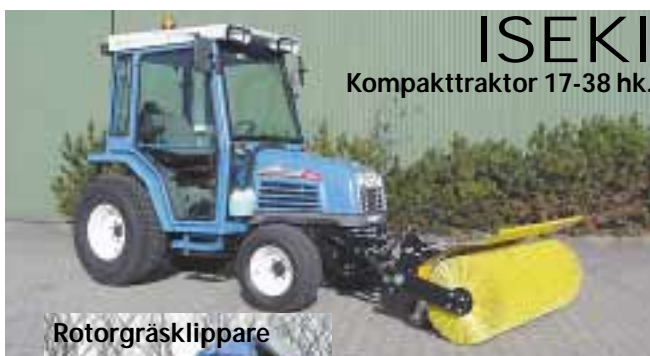
ISEKI Kompaktraktor 17-38 hk.