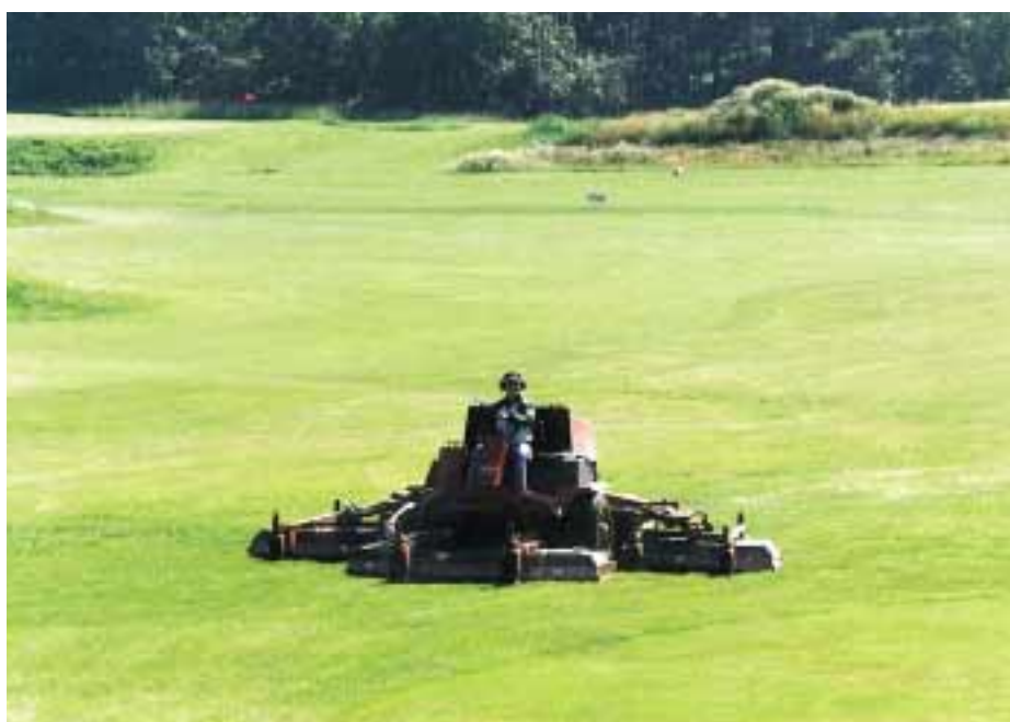
Toro är världsledande på gräsvård och har en mängd produkter för gräskötsel på golfbanor och andra sportarenor samt för parker.

För underhållet av banorna använder sig Fors Golf av maskiner av kvalitetsmärket Toro, levererade av Hako Ground & Garden AB i Järfälla. Toro är världsledande på gräsvård och har en mängd olika