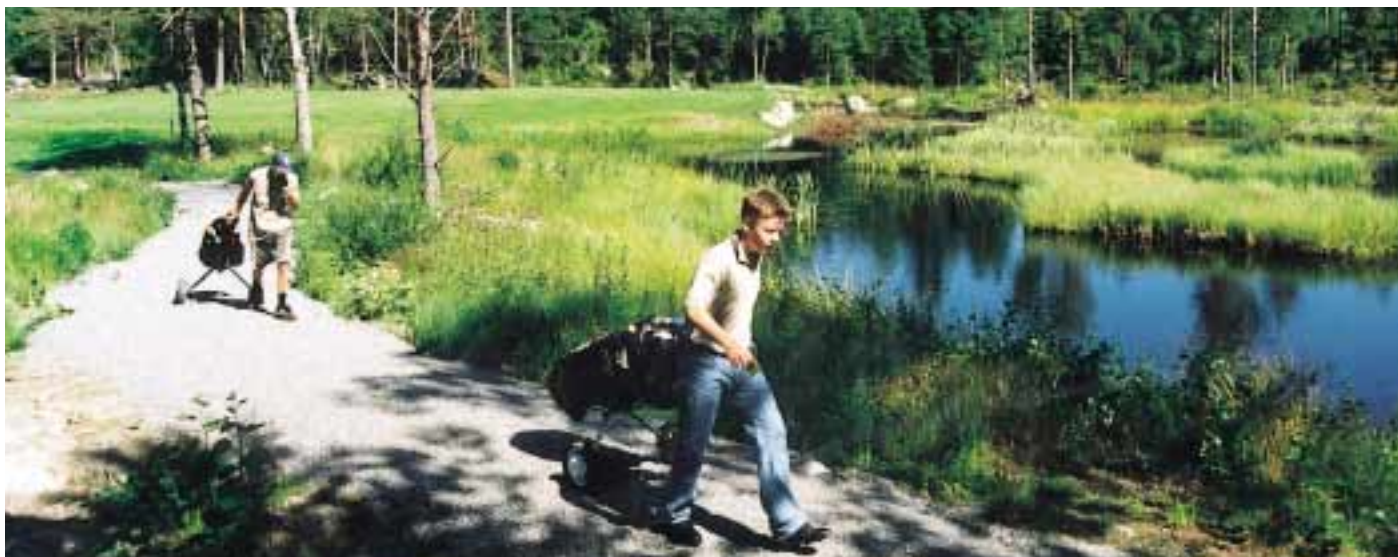
Fors Golf i Västerhaninge är en nyanlagd 9-håls parkbana och fungerar som pay & play-anläggning.

anlagt banan med ambitionen att den ska vara spännande och vacker utan att göra för stora ingrepp i den omgivande naturen. De nio hålen håller par 35 på cirka 2 550 meter från gul tee, 2 040 meter från röd.