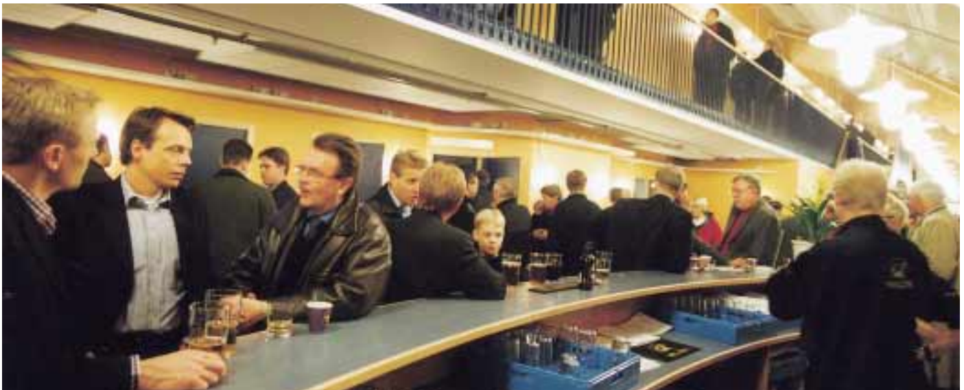
Bara att kliva in i foajén i toppmoderna Kinnarps Arena är en upplevelse. Man kan tro att man hamnat i en hotellobby.

Rosenlundshallen i Jönköping, Sveriges första inomhusanläggning för ishockey, var visserligen charmig, men sliten och otidsenlig. En ny arena stod högst på önskelistan för HV 71 men kommunen saknade pengar så föreningen fick försöka på egen hand. Man bildade ett bolag som övertog anläggningen av kommunen och handplockade en styrelse med folk ur det lokala näringslivet.